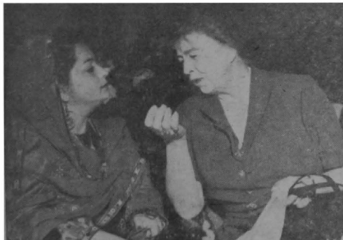
The photograph shows Begum Liaquat Ali (left) talking with Mrs. Roosevelt on the status of women in Pakistan.