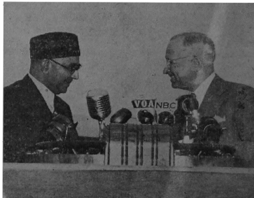
The photograph shows Prime Minister L'quat All Khan (left) and President Truman on the speaker's stand at National Airport, Washington, as they exchanged official greetings.

And the classification of the Union's population into races