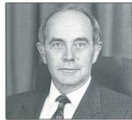
Regter Johann Kriegler (Voorsitter)