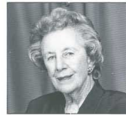
Dr. Helen Suzman