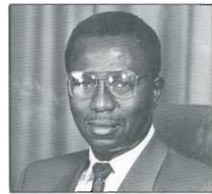
Advokaat Dikgang Moseneke SC (Ondervoorsitter)