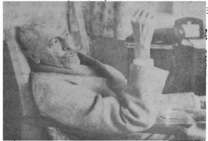
મૌલાના અબુલ કલામ આઝાદ

નયરોષીના હાઈના હાય કમીશનર તરફથી પ્રેસ બ્લેક એક નિવેદન ૨૩મી ફેબ્રુઆરીના બહાર પાડવામાં આવ્યું છે. જેમાં હાઈના જુના આઝાદીના લડવૈયા મૌલાના આઝાદની આછી રૂપરેખા અને તેમના અવસાન ના દુઃખદ સમાચાર આપવામાં આવ્યા છે તે નીચે સુજ્ઞ છે.