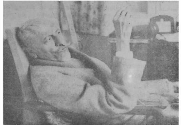
MAULANA ABUL KALAM AZAD