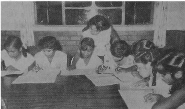
શિક્ષણ લેતી બાલિકાઓ

અપીલ નમ્ર નિવેદન : બહેર જનતાને અમારી નમ્ર અરજ છે કે : (૧) આપ આ આશ્રમની સુલાકાત લો. જેથી આપ એના કાર્યને સમજી શકો.