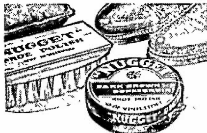
So, the very next morning, those shoes got a thorough going over with Nugget. I packed a Nugget cleaning outfit, too. And I must admit it really did something to my appearance.