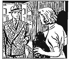
That night, someone knocks at the door of the flat, and Sally is scared it is Geoff Kroom—and she is alone! But it is Peter.