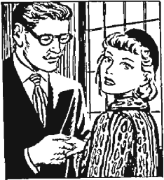
Sally tells Bailey about Kroom's phone call. "Sally, marry me and let me look after you!" "But there is Peter—I can't!" she says.

Sally Ross, actress, is engaged by John Bailey, a film director as a stand-in for the star, Magda Frayne. She is Magda's double. Sally meets again Peter Brett, camera-man, who loves her, proposes, and is accepted. Bailey confesses Magda is missing, and persuades Sally to take the star's place. Later, Sally finds a threatening note and Bailey tells the police, begging them to keep quiet about Sally's impersonation. Peter, meanwhile, thinks Sally has run out on him. A man enters Sally's room,—it is Magda's husband, Geoff Kroom! He takes money and vanishes. Then word comes that Magda has been found murdered! The make up man reports a blonde wig is missing, and Carol Do, the actress who wants Peter, says she saw Magda with it. Carol is seen dancing with Geoff Kroom but he disappears, Carol saying he just asked her to dance and that she does not know him. Then Geoff Kroom threatens Sally again!