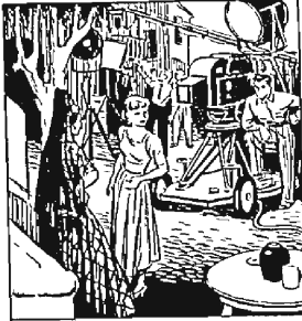
During the "shooting" of a scene, Sally thinks Peter is looking at her intently. Is he suspicious? Could she have betrayed in any way, that she is not Magda Frayne?